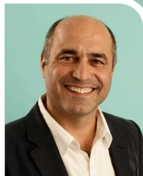
JEAN-LOUIS ROUMÉGAS Député de l'Hérault

Pour lutter contre l'épidémie de maladies chroniques (cancer, diabète, obésité, maladies cardio-vasculaires et respiratoires, troubles neurologiques...), protégeons les populations !